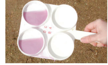
ಮಂದ ದ್ರಾವಣ ಅಥವಾ ದ್ರಾವಣದಲ್ಲಿ ಸಣ್ಣ ಸಣ್ಣ ಗಡ್ಡೆಗಳು ಕಾಣಿಸಿದಲ್ಲಿ ಸುಪ್ತ ಕೆಚ್ಚಲು ಬಾವು ಎಂದು ತಿಳಿಯಿರಿ