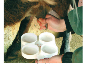
ನಾಲ್ಕು ಮೊಲೆಗಳಿಂದ ತಲಾ ಎರಡು ಮಿಲಿ ಹಾಲನ್ನು ಕರೆಯಿರಿ