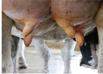
ಮೊದಲಿಗೆ ಪ್ರತಿ ಮೊಲೆಗೆ ಡೆಟಾಲ್ ಅಥವಾ ಸಾವಲಾನ ದ್ರಾವಣದಲ್ಲಿ ಅದ್ದಿ 30 ಸೆಕೆಂಡ ವರೆಗೆ ಬಿಡಬೇಕು