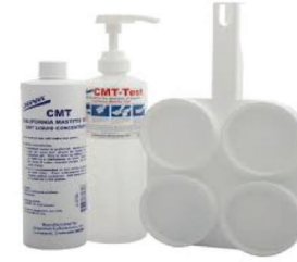
ಕ್ಯಾಲಿಫೋರ್ನಿಯಾ ಕೆಚ್ಚಲು ಬಾವು ಪರೀಕ್ಷೆ ಕಿಟ್

3. ಹಾಲು ಹಾಗೂ ದ್ರಾವಕಗಳು ಬೆರೆತಾಗ ಗಣನೀಯ ಪ್ರಮಾಣದಲ್ಲಿ ಮಂದವಾದ ಜೆಲ್ ರೀತಿಯ ದ್ರಾವಣ ಉಂಟಾದಲ್ಲಿ - ನಿಶ್ಚಿತವಾಗಿಯೂ ಈ ಹಾಲು ಕೆಚ್ಚಲುಬಾವು ತೀವ್ರತೆ ಹಸುವಿನದೆಂದು ಅಭಿಪ್ರಾಯಪಡಬಹುದು.