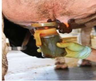
ಹಾಲು ಕರೆಯುವೆಕೆಯ ನಂತರ, ಪ್ರತಿ ಮೊಲೆಗೆ ಸಮವಾಗಿ ಸೋಂಕು ನಿವಾರಕ ಅನ್ವಯಿಸುವುದು